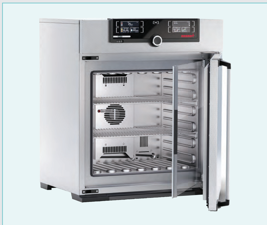
Exacta Labcenter distribuisce la camera climatica HPP110 di Memmert. Exacta Labcenter distributes the HPP110 climatic chamber from Memmert.

In over sixty years, the company has come a long way, continuing with its staff to create temperature-controlled and