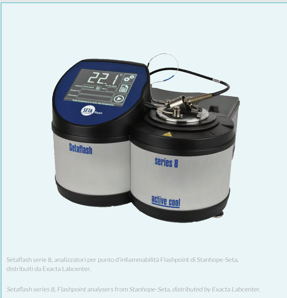
Setaflash serie 8, analizzatori per punto d'infiammabilità Flashpoint di Stanhope-Seta, distribuiti da Exacta Labcenter.