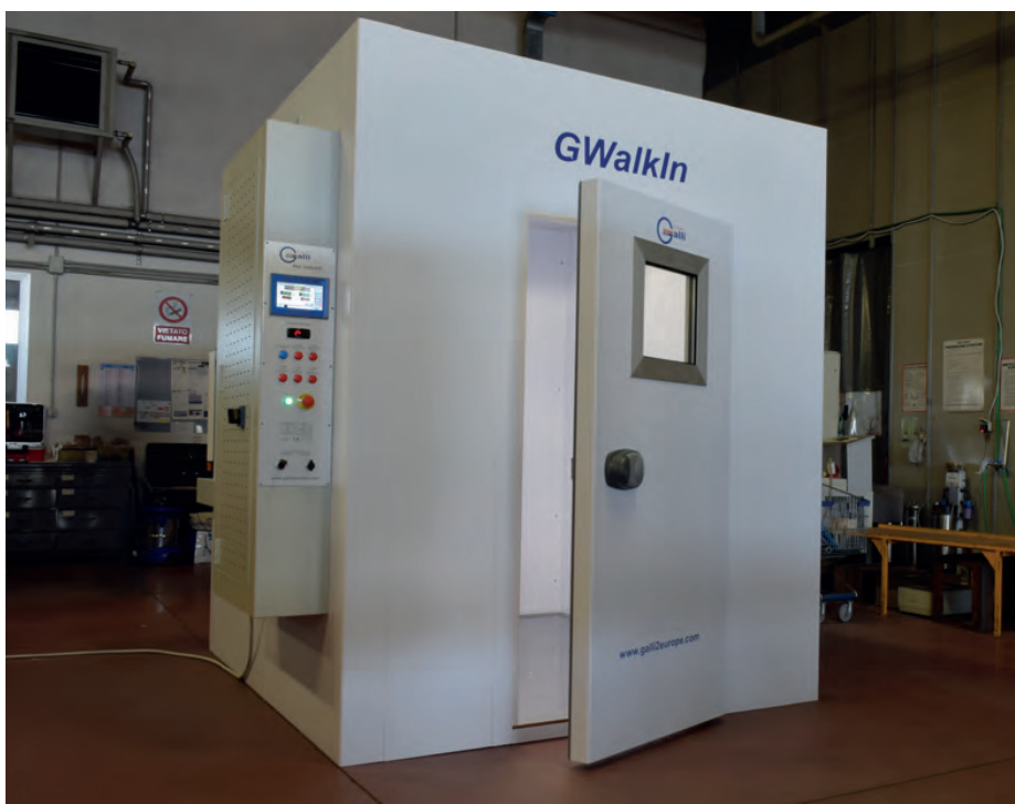
Il modello GWalkIn, la cella climatica accessibile di Fratelli Galli. The GWalkIn model, the accessible climate cell from Fratelli Galli.

Prospero, near Modena, said. «Seventy per cent of our business is geared towards industrial laboratories, from oil and gas laboratories to testing laboratories, that is, facilities that carry out tests for third parties.»