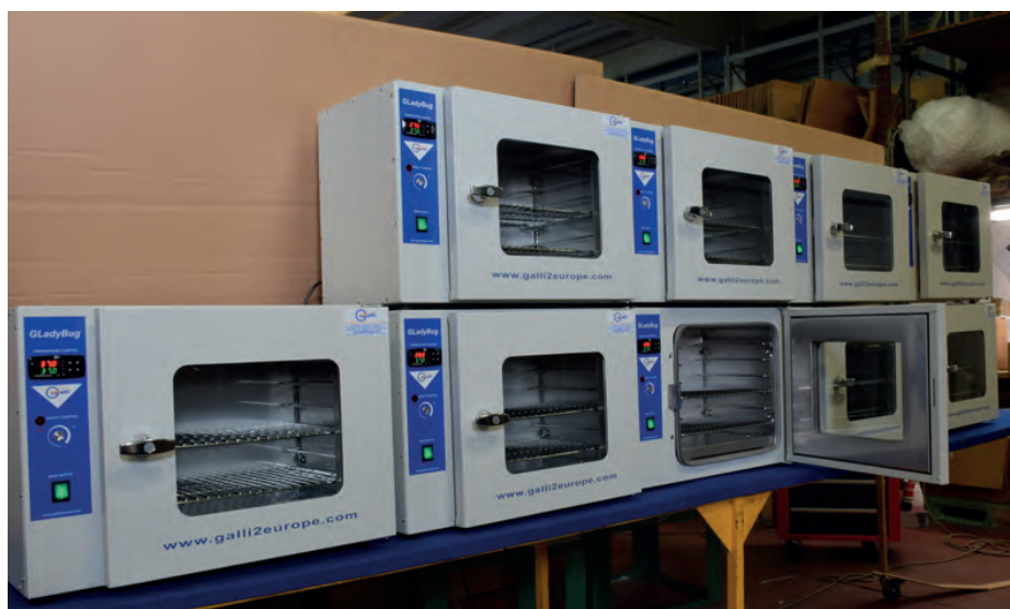
Il modello GLadyBug, piccola stufa da laboratorio di Fratelli Galli. The GLadyBug model, a small laboratory stove by Fratelli Galli.

«Abbiamo selezionato una proposta strumentale per analisi materiali di alto profilo e