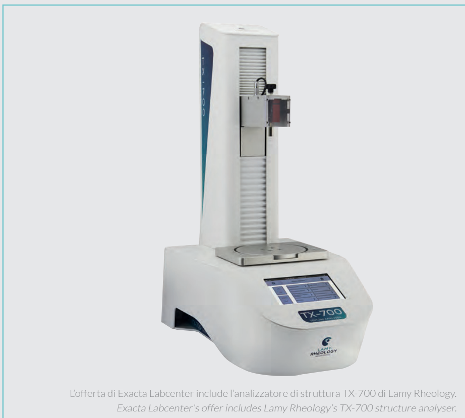
L'offerta di Exacta Labcenter include l'analizzatore di struttura TX-700 di Lamy Rheology. Exacta Labcenter's offer includes Lamy Rheology's TX-700 structure analyser.