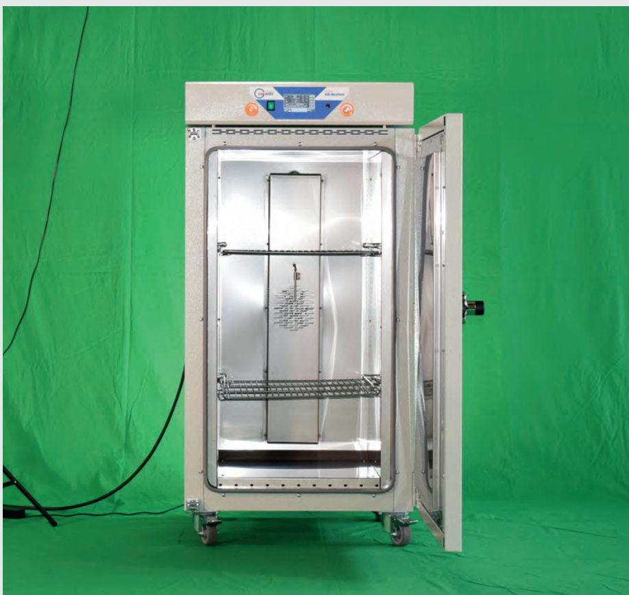
Stufa termostatica high performance a ventilazione forzata, modello 2100, di Fratelli Galli. High performance thermostatic stove with forced ventilation, model 2100, by Fratelli Galli.

Fratelli Galli è presente anche all'estero, con una serie di distributori qualificati. •